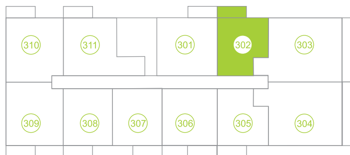
Půdorys podlaží / Floor plan